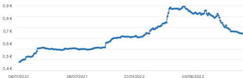
Preisentwicklung in €/g

Der Gallium-Preis ist seit 01.01.2021 bis zum 31.01.2023 um 64,8 Prozent gestiegen.